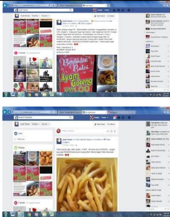
Caption : Promosi produk makanan di Facebook

iv) Lain-lain (contoh : proses penghasilan produk, penglibatan dalam aktiviti lain, dsb)