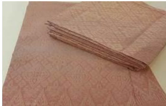
Caption : Antara perkhidmatan yang disediakan iaitu baju kelengkapan perkahwinan, gubahan hantaran, majlis berendoi dan sebagainya.